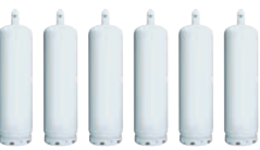
※50kg容器的場合は6本以上